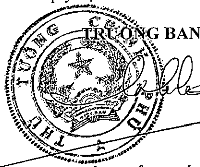
PHÓ THỦ TƯỚNG Trương Hòa Bình

Nội dung và định mức chi thực hiện theo quy định tài chính hiện hành.